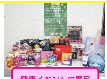
健康イベントの景品