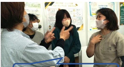
健康イベント後、談笑するSTAFF

A 3. 「大きくなくていい。でも、 無くては困る事業所であり続けること 」です。人生の最期までその人らしく生きていけるようにしっかりと支え、寄り添うこと。利用者の意向に沿った尊厳のある生活を利用者家族と共に支えていけるように、信頼関係を築きます。それが「クレド」が目指すべき方向です♥